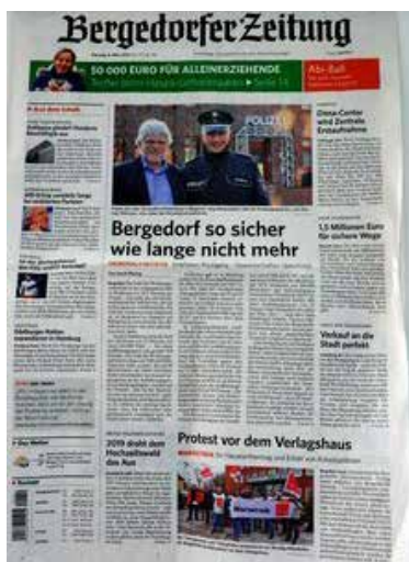
Die „Bergedorfer Zeitung“ berichtete über den Warnstreik im eigenen Haus.