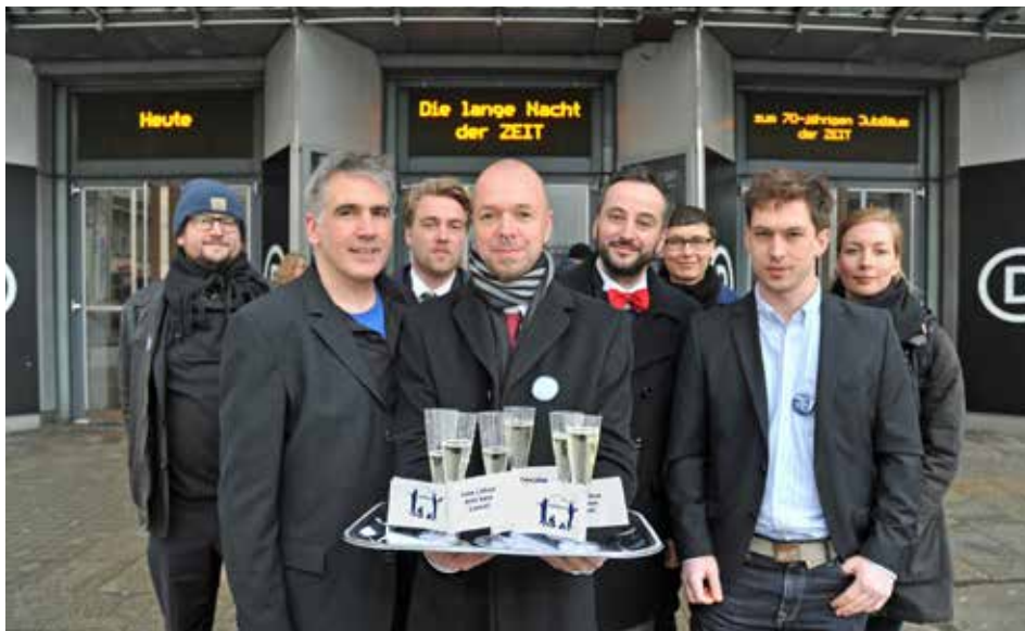
Stilvoller Protest: Berliner Beschäftigte von Zeit-Online empfangen die Gäste der „Langen Nacht der Zeit“ anlässlich des 70. Jubiläums des Blatts mit Sekt und dem Hinweis „Faire Löhne sind kein Luxus“.

Während die Zeit-Beschäftigten in Hamburg nach Branchentarifvertrag bezahlt werden, arbeiteten die Onliner für niedrigere Gehälter. Laut Betriebsrat verdienen sie im Jahr durchschnittlich 10.000 Euro weniger. Die Online-Beschäftigten fordern so wie die Print-Kolleginnen und -Kollegen bezahlt zu werden. In mehreren Tarifverhandlungen hatten die Gewerkschaften dju/ver.di, DJV und VJBB dem Arbeitgeber einen Kompromissvorschlag vorgelegt. Danach sollte stufenweise die Vergütung auf Tarifniveau angeboten werden. Bisher gab es keine Einigung.